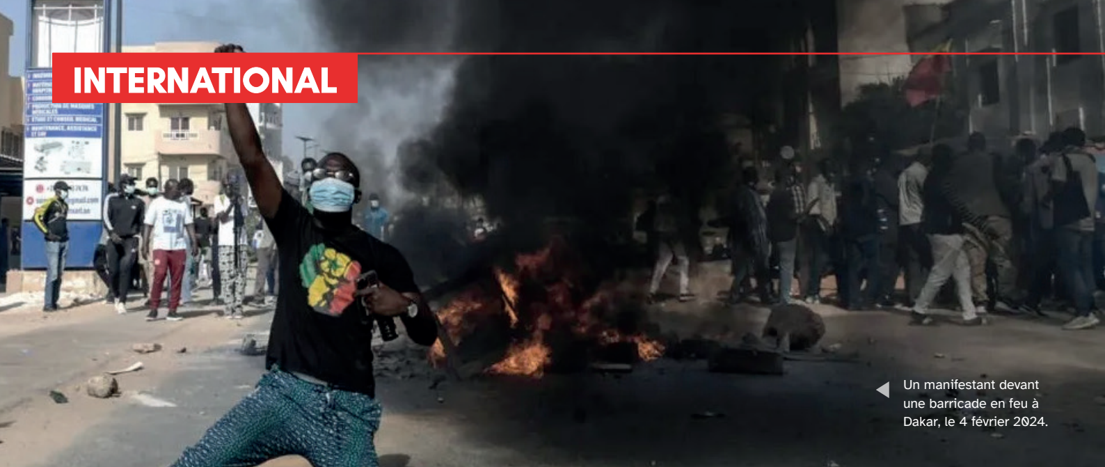
◀ Un manifestant devant une barricade en feu à Dakar, le 4 février 2024.