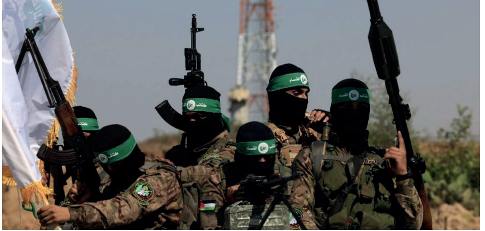
Des combattants palestiniens des Brigades Al-Qassam, dans la bande de Gaza, le 19 juillet 2023.

Cette année marque, en France, les 40 ans d'emprisonnement du combattant anti-impérialiste et antisioniste libanais Georges Ibrahim Abdallah, accusé de complicité d'assassinat de deux diplomates américain et israélien à Paris, en 1982. Dans sa dernière déclaration, il nous rappelle : « Ce peuple a mis en échec toute la politique colonialiste de peuplement mis en œuvre depuis plus d'un siècle par l'ex-