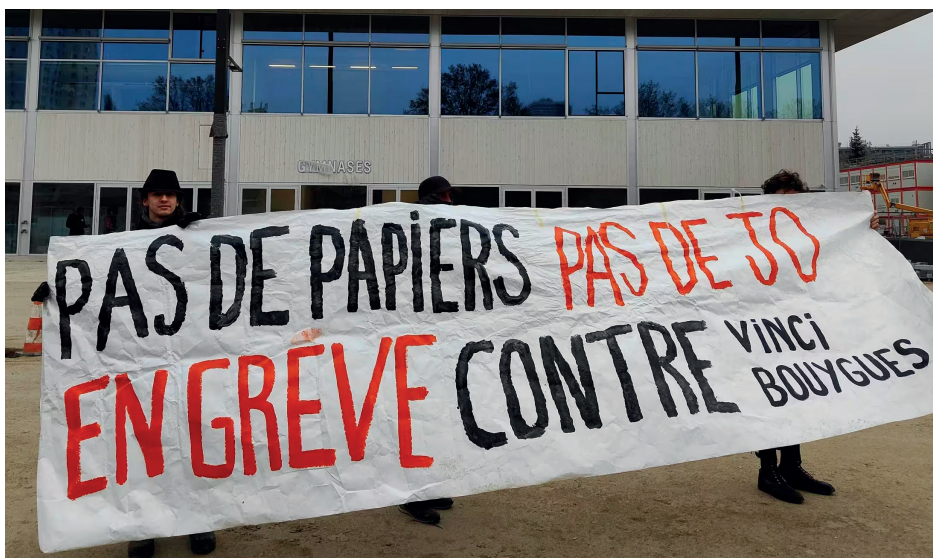
▼ Des manifestants devant le chantier de l'Arena à Paris, le 1 er décembre 2023. Bouygues, le groupe en charge du chantier, a employé une centaine de sans-papiers, sans contrats ni fiche de paye.

► Lire notre article du n°73 de la Cause du Peuple, octobre-novembre 2023 : « Emmaüs : "Abbé Pierre, réveille-toi, ils sont devenus fous!" »