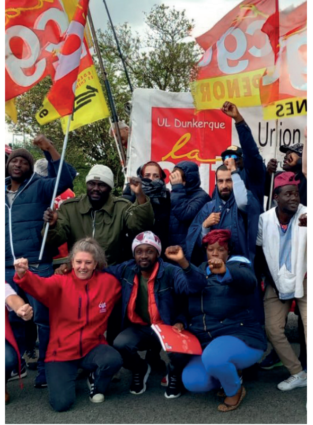
▲ Grévistes sans-papiers d'Emmaüs Grande-Synthe, à côté de Dunkerque, qui ont rejoint le mouvement lancé par les grévistes de Saint-André-lez-Lille (Nord).

dans le contexte de l'arrivée imminente des Jeux Olympiques, fête bourgeoise qui, avec les différents chantiers dont l'échéance arrive à terme, emploie de nombreux travailleurs et travailleuses sans-papiers. La bourgeoisie est terrifiée à l'idée d'une révolte ou d'une nouvelle grève à l'image de l'occupation en octobre dernier du chantier de l'Arena par des ouvriers sans-papiers. Au total, ce sont donc 620 régularisations gagnées par la CGT, dont 502 travailleurs et travailleuses sans-papiers franciliens en grève depuis le 17 octobre, essentiels au bon déroulement de leurs petites festivités. La victoire des compagnons d'Emmaüs du Nord est d'autant plus remarquable que ces derniers ont dû endurer tout le long de leur grève héroïque les coups les plus bas : coupure du chauffage, menaces de fermeture du site, mobilisation fasciste en soutien à la direction, provocations racistes avec le dépôt d'une tête de sanglier sur le piquet, injures... Ces tentatives infructueuses de déstabilisation n'ont pourtant pas suffi à entamer la détermination