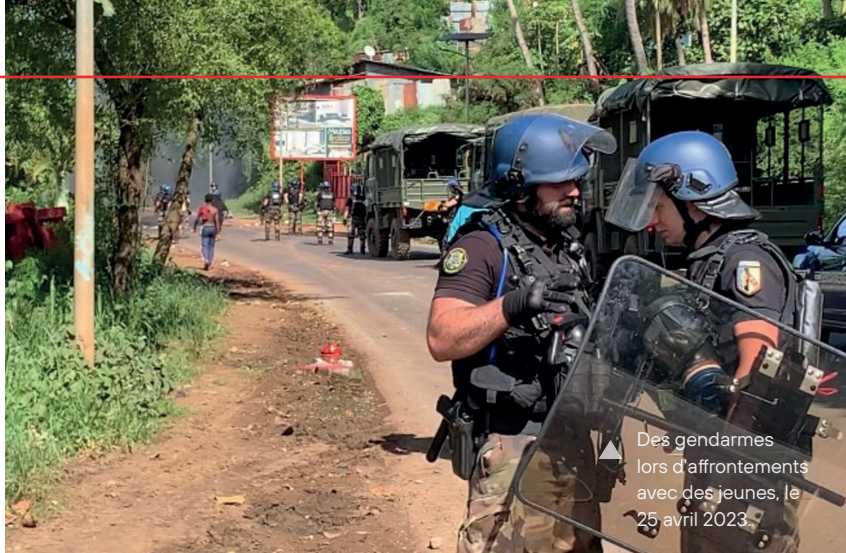
Des gendarmes lors d'affrontements avec des jeunes, le 25 avril 2023.

Mais c'est peine perdue, la réactionnarisation de l'État bourgeois français se poursuit frénétiquement ces dernières années. La seule classe capable de changer la donne, c'est le prolétariat, car il porte la tâche d'abattre l'État bourgeois et avec lui, la réaction sur toute la ligne.