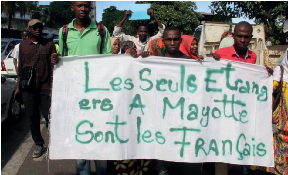
▲ Manifestations devant l'ambassade française aux Comores en 2018.

C'est en 1851 puis en 1889 que la loi fixe le droit du sol fortement dans le droit français. Pourquoi ça ? C'est l'époque où le capitalisme français a besoin de main d'œuvre et ne peut pas se reposer seulement sur les anciens paysans, qui n'arrivent pas assez vite en ville ou sont morts dans les guerres successives. Il faut donc des immigrés qu'on ira chercher en Italie, Espagne, Belgique... Ainsi on notera par exemple que 1889, quand arrive la nouvelle loi, c'est presque 20 ans après 1870-71, époque de la guerre Franco-Prussienne et de la Commune ; il y aura donc forcément des absents dans les classes d'âge qui doivent effectuer le service militaire, car leurs potentiels parents sont morts à la guerre. La loi de cette année-là reflétera cette réalité pour forcer les jeunes enfants d'étrangers à faire le service militaire à leur majorité.