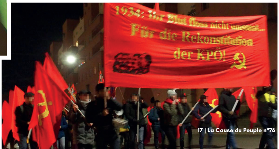
Sur la banderole, on peut lire : ► « 1934 : Leur sang n'a pas coulé en vain... Pour la reconstitution du Parti Communiste d'Autriche ! »