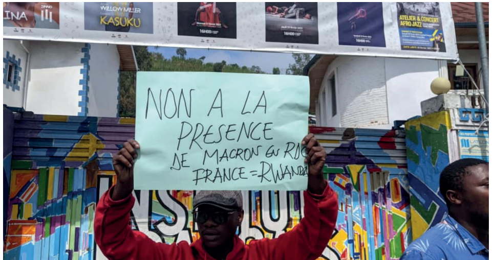
Des manifestants devant l'Institut français de Goma, le 2 mars 2023, lors de la venue d'Emmanuel Macron en RDC.

« Les Occidentaux sont derrière le pillage de notre pays. Le Rwanda ne fonctionne pas seul, ils doivent donc quitter notre pays », a déclaré un manifestant à Reuters. La foule a jeté des pierres sur l'ambassade américaine, brûlé des drapeaux, et détruit des magasins étrangers, comme celui de la chaîne française Canal+. Plusieurs véhicules de la mission dite de « maintien de la paix » de l'ONU ont été incendiés et pillés dans l'est de la RDC. La police a réprimé les manifestants en tirant des gaz lacrymogènes et en gardant plusieurs ambassades, notamment les ambassades de France et des États-Unis. Ceux-ci ont d'ailleurs de-